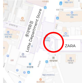
명동 Myeongdong 명동 지하 쇼핑센터 15번 출구 Myeongdong Shopping center 15 gate