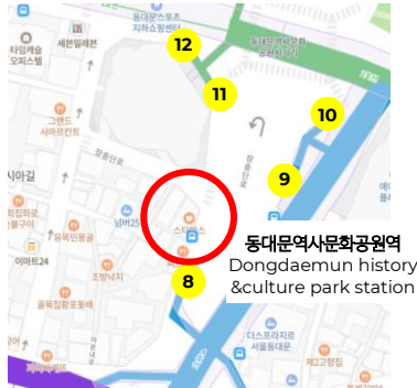
동대문 쇼핑타운 Dongdaemun Shopping Town 롯데 피트니스&스타벅스 동대문 공원점 Lotte fitin&Starbucks(Dongdeamun Park)