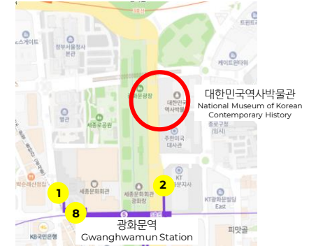
경복궁 Gyeongbok Palace 대한민국역사박물관 National Museum of Korean Contemporary History