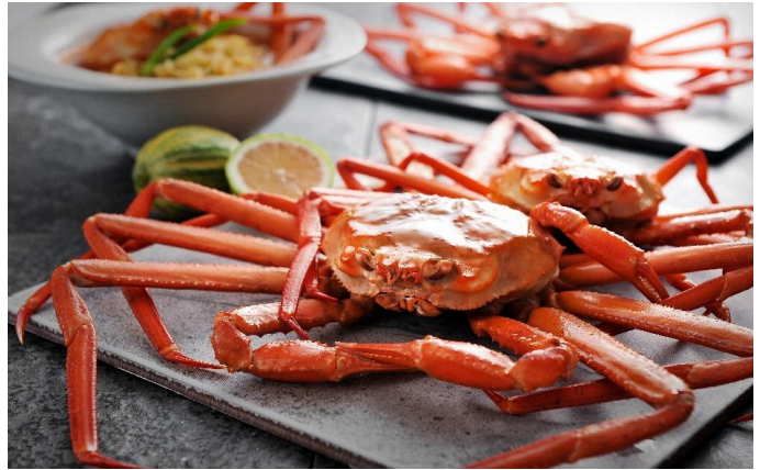
*상기 이미지는 연출용입니다.